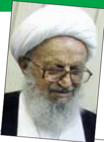
اجلاسیه اساتید مدارس قم با حضور آیه‌الله العظمی مکارم