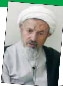
گفتگو با دبیر شورای عالی حوزه